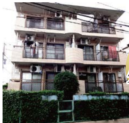
外観 平成26年7月撮影