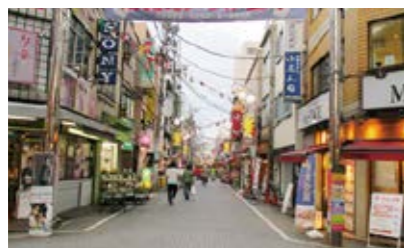
周辺環境(東十条商店街)