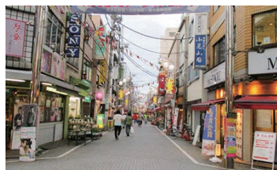
周辺環境(東十条商店街)