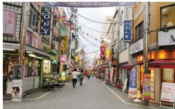
周辺環境 (東十条商店街)