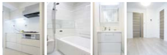
建具:ノスタルエルム / 床:アラジンオーク