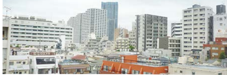
バルコニーからの眺望 平成29年10月撮影