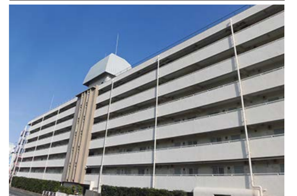
外観 平成30年2月撮影