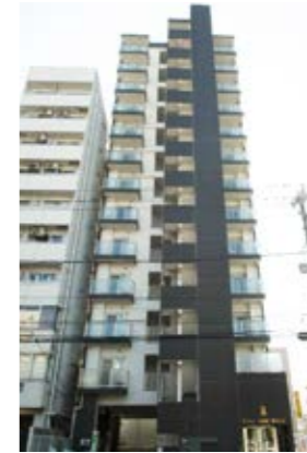
外観 平成30年3月撮影