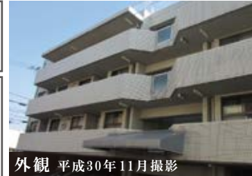
外観 平成30年11月撮影