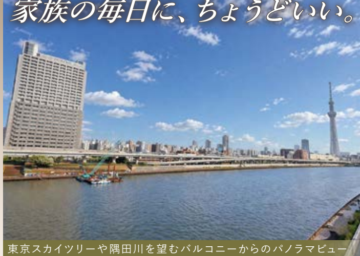
東京スカイツリーや隅田川を望むバルコニーからのパノラマビュー

再開発で整う街並みと下町のぬくもりある暮らしやすさ 家族の毎日に、ちょうどいい。