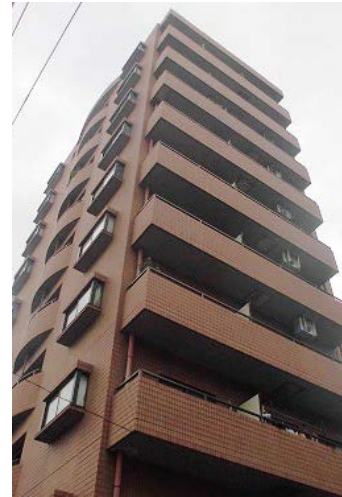
外観 平成31年1月撮影