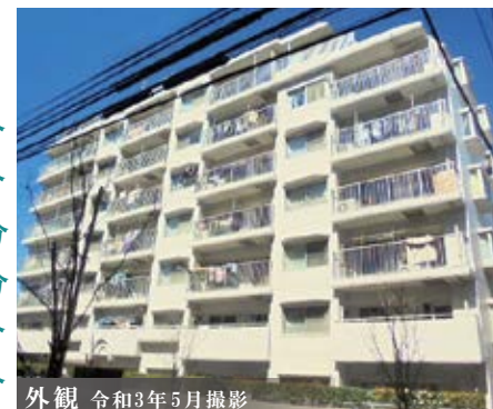
外観 令和3年5月撮影