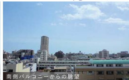
南側バルコニーからの眺望