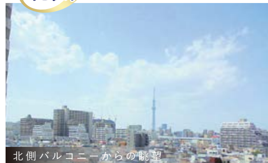
北側バルコニーからの眺望