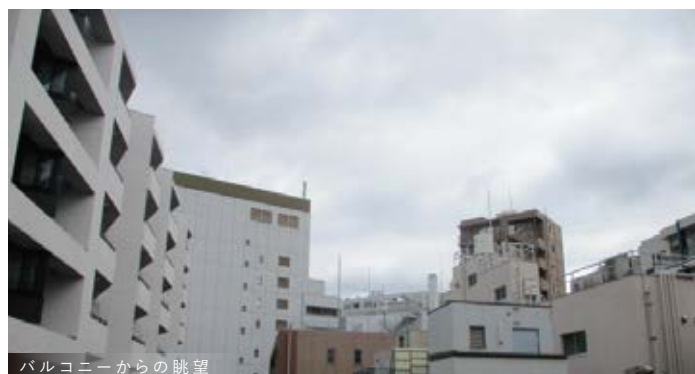
バルコニーからの眺望