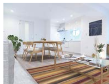
〈バーチャルホームステージング〉 ※画像はイメージです。 実際の家具配置とは異なる場合がございます。

ローソン ……徒歩1分 ドンキホーテ ……徒歩3分 マツモトキヨシ ……徒歩6分 成城石井 ……徒歩6分