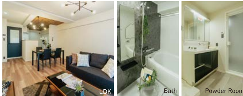
〈ホームステージング〉※実際の家具配置とは異なる場合がございます。