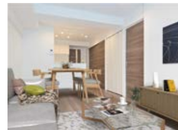
〈バーチャルホームステージング〉 ※画像はイメージです。実際の家具配置とは異なる場合がございます。