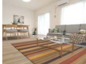
〈バーチャルホームステージング〉 ※画像はイメージです。 実際の家具配置とは異なる場合がございます。