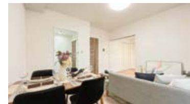
〈ホームステージング〉 ※実際の家具配置とは異なる場合がございます。