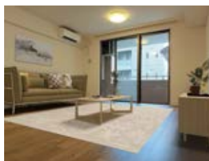
※画像はイメージです。実際の家具配置とは異なる場合がございます。