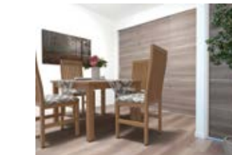
〈バーチャルホームステージング〉 ※画像はイメージです。実際の家具配置とは異なる場合がございます。