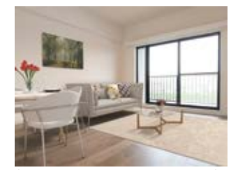
〈バーチャルホームステージング〉 ※画像はイメージです。 実際の家具配置とは異なる場合がございます。