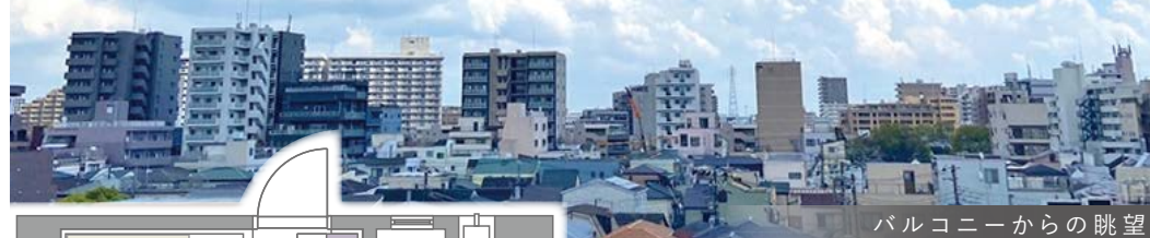
バルコニーからの眺望