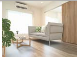
〈バーチャルホームステージング〉 ※画像はイメージです。 実際の家具配置とは異なる場合がございます。