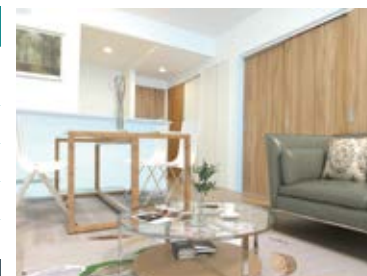
〈バーチャルホームステージング〉 ※画像はイメージです。実際の家具配置とは異なる場合がございます。