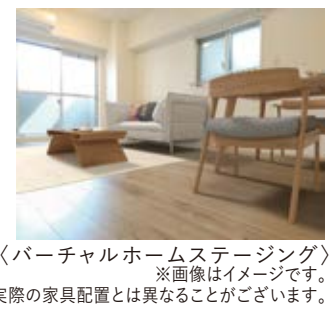
〈バーチャルホームステージング〉 ※画像はイメージです。実際の家具配置とは異なる場合がございます。