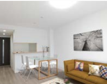
〈バーチャルホームステージング〉 ※画像はイメージです。 実際の家具配置とは異なる場合がございます。