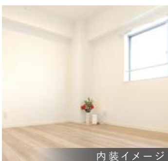
※内装写真はイメージです。実際とは異なる場合がございます。