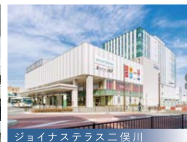
ジョイナステラス二俣川