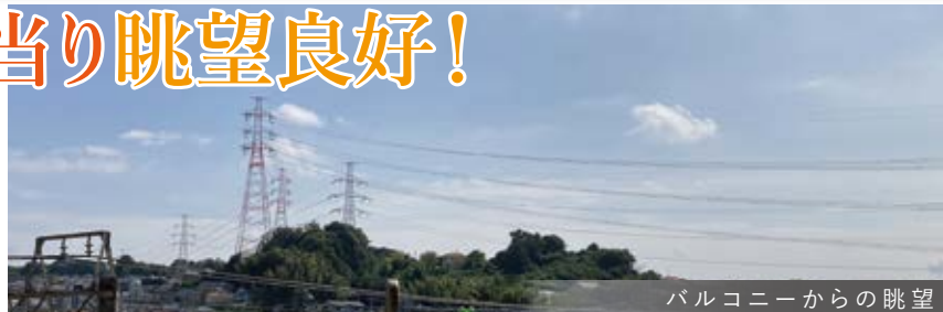
バルコニーからの眺望

ペット飼育可!(犬猫合わせて2匹まで 細則有) 総戸数 220戸 のビッグコミュニティー