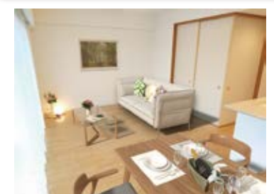
〈バーチャルホームステージング〉 ※画像はイメージです。 実際の家具配置とは異なる場合がございます。