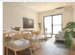
〈バーチャルホームステージング〉 ※画像はイメージです。実際の家具配置とは異なる場合がございます。