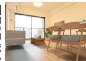
〈バーチャルホームステージング〉

※上記内容と現況が異なる場合は、現況優先とさせていただきます。 ※画像はイメージです。実際の家具配置とは異なる場合がございます。