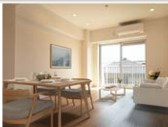
〈バーチャルホームステージング〉 ※画像はイメージです。 実際の家具配置とは異なる場合がございます。