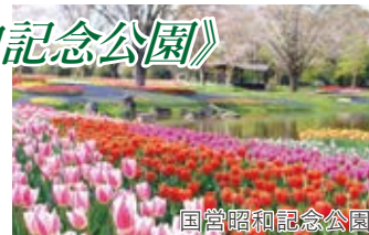
国営昭和記念公園