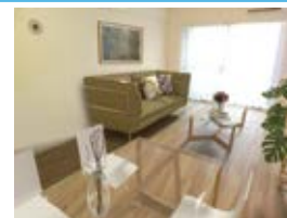
〈バーチャルホームステージング〉 ※画像はイメージです。実際の家具配置とは異なる場合がございます。