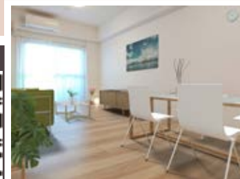
〈バーチャルホームステージング〉