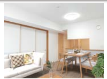
〈バーチャルホームステージング〉 ※画像はイメージです。実際の家具配置とは異なる場合がございます。