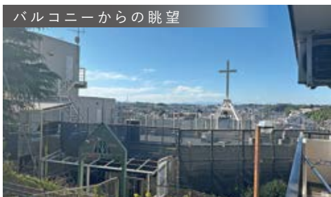
バルコニーからの眺望