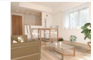
〈バーチャルホームステージング〉 ※画像はイメージです。 実際の家具配置とは異なる場合がございます。