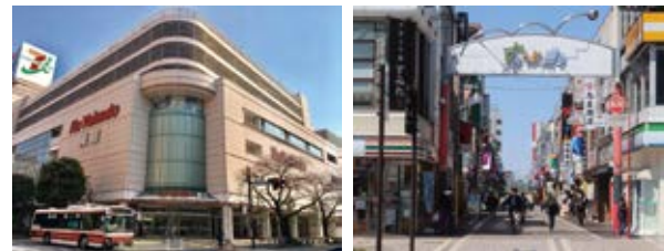
イトーヨーカドー武蔵境 すきっぷ通り商店街

🚆 乗換なしでダイレクトアクセス 「吉祥寺」駅まで4分 「新宿」駅まで20分 「東京」駅まで36分