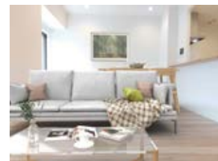
〈バーチャルホームステージング〉 ※画像はイメージです。実際の家具配置とは異なる場合がございます。