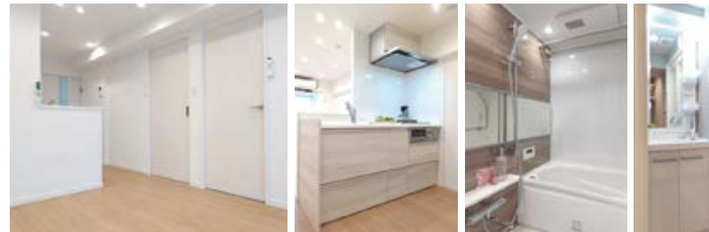
LDK/キッチン/浴室/洗面化粧台