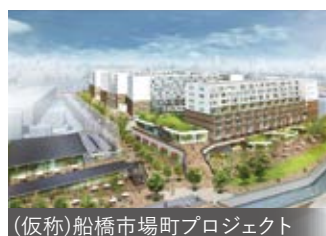
(仮称)船橋市場町プロジェクト