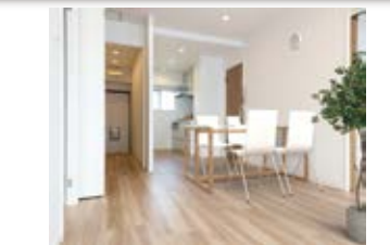
〈パースナルホームステージング〉 ※画像はイメージです。 実際の家具配置とは異なる場合がございます。