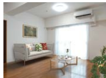
〈バーチャルホームステージング〉 ※画像はイメージです。 実際の家具配置とは異なる場合がございます。