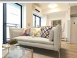
〈バーチャルホームステージング〉 ※画像はイメージです。 実際の家具配置とは異なる場合がございます。