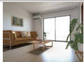
〈バーチャルホームステージング〉 ※画像はイメージです。実際の家具配置とは異なる場合がございます。