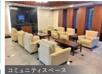
コミュニティスペース