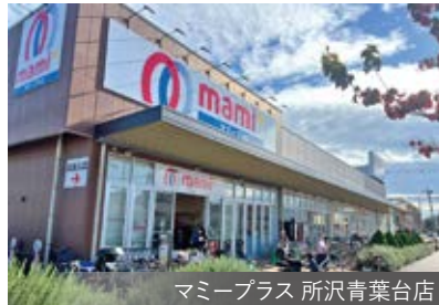
マミープラス 所沢青葉台店