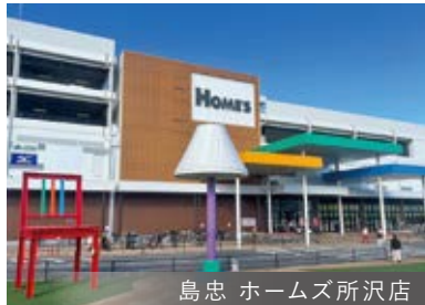
鳥忠 ホームズ所沢店