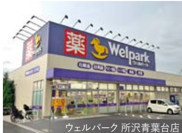
ウェルパーク 所沢青葉台店