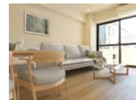
〈バーチャルホームステージング〉 ※画像はイメージです。実際の家具配置とは異なる場合がございます。