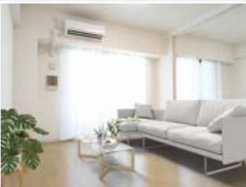
〈バーチャルホームステージング〉 ※画像はイメージです。 実際の家具配置とは異なる場合がございます。