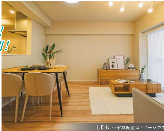
LDK ※家具配置はイメージです。