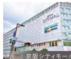
京阪シティモール