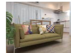
〈バーチャルホームステーjing〉 ※画像はイメージです。 実際の家具配置とは異なる場合がございます。