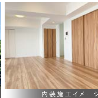
内装施工イメージ

桜並木やアスレチック広場がある『富岡総合公園』が至近です また『鳥見ヶ丘第二公園』が隣接しています