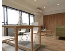
〈バーチャルホームステージング〉 ※画像はイメージです。実際の家具配置とは異なる場合がございます。