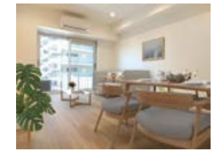
〈バーチャルホームステージング〉 ※画像はイメージです。実際の家具配置とは異なる場合がございます。